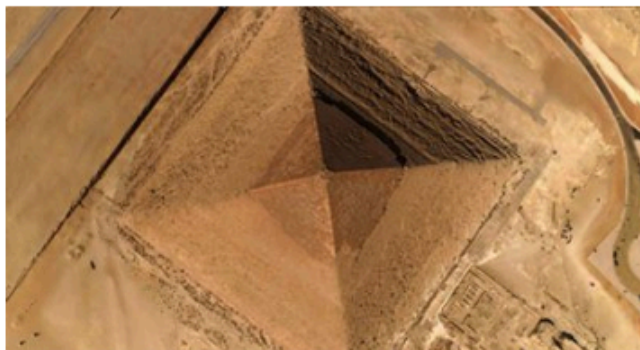
Pyramids: Solving the Mystery involves an extensive aerial survey of Egypt's historic sites

Press agency Label News has linked up with French producer and distributor ZED on a show that will attempt to explain how major archaeological sites in Egypt were built.